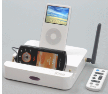
音楽携帯をサポート(ノキア、モトローラ、サムスン、ソニーエリクソン)