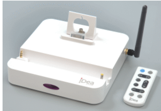
900MHz (外部アンテナ付き)