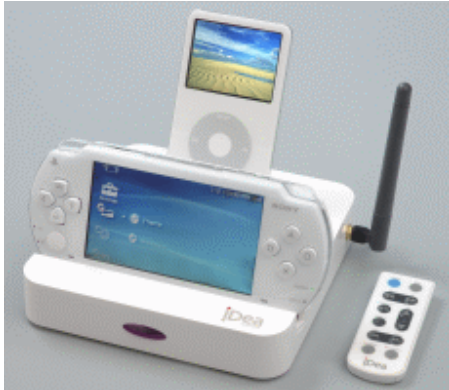
iPod と PSP をサポート

iDea ワイヤレスホームドックは、iPod、PSP、ウォークマン携帯(ノキア、モトローラ、サムスン、ソニーエリクソン)、シャッフル、MP3/MP4 プレーヤーなどなどをサポート。