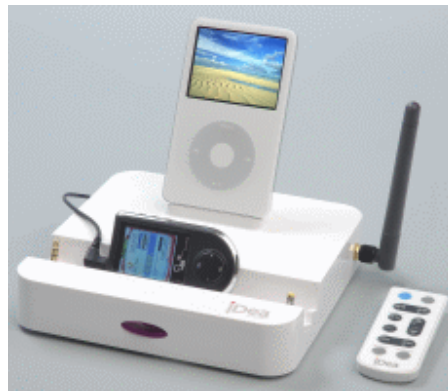
iPod と MP3/MP4 で使用