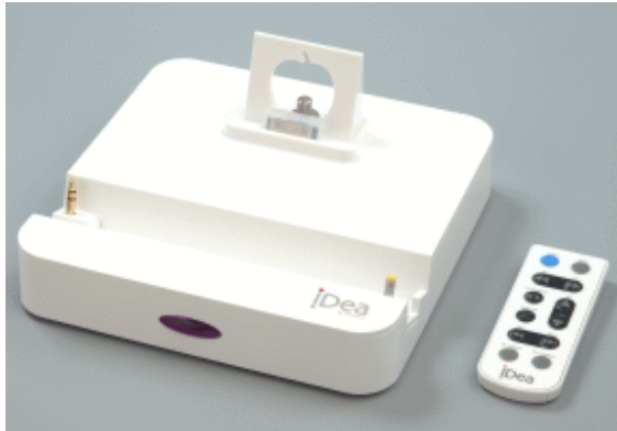
2.4 GHz (チップアンテナ内蔵)