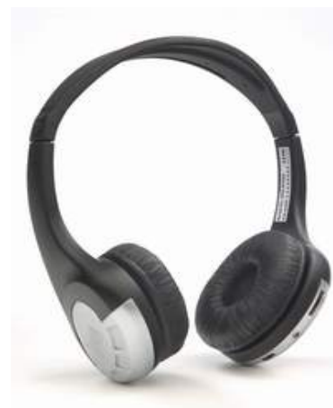
iDea ワイヤレスHD-オーディオ Hi-Fiレシーバー (ヘッドフォン レシーバー) iDea ワイヤレスHi-Fiヘッドセ ット