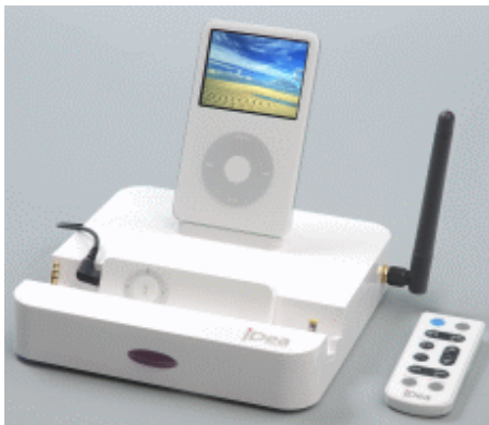
iPod とシャッフルで使用